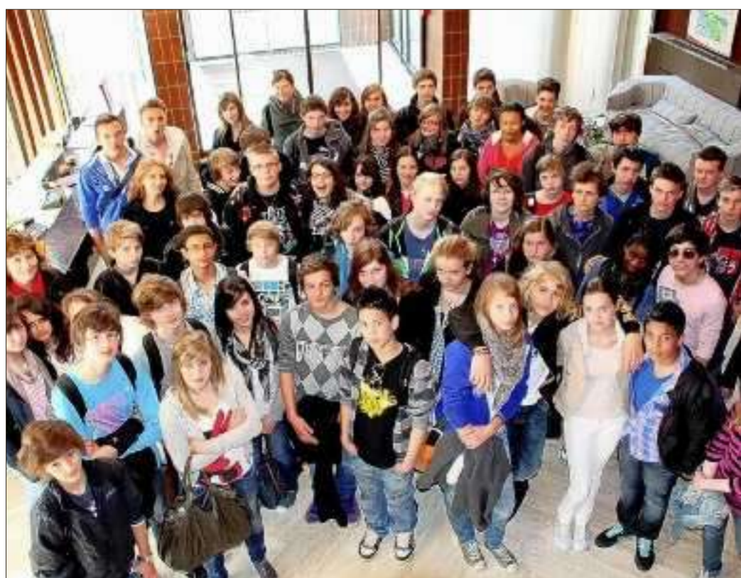
Ces jeunes visiteurs ont été très attentifs à l'histoire de leur quotidien régional.

Une cinquantaine d'élèves, des collégiens de Philippe-de-Vigneulles, à Metz-Queuleu, et leurs correspondants allemands de Stuttgart, accompagnés de leurs enseignantes, ont visité le siège du Republicain Lorrain , à Woippy.