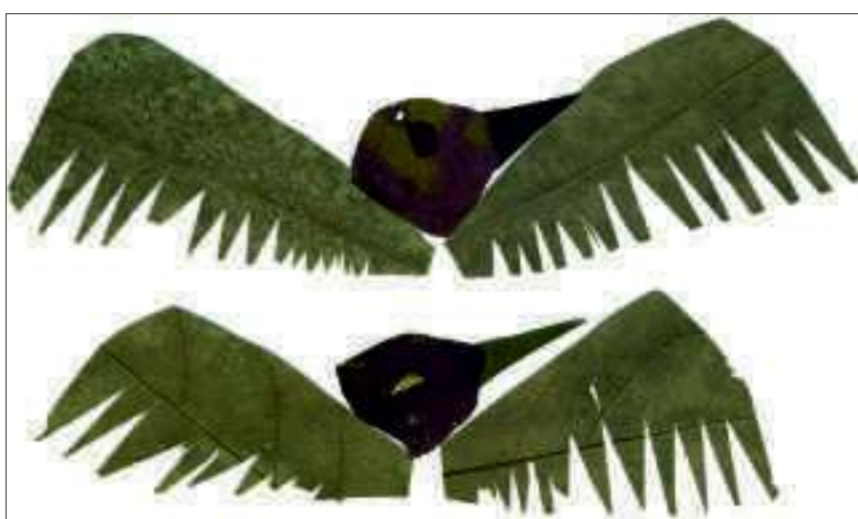
Tous les dessins de cette page sont visibles sur le Muz, le Musée des enfants. Et tous les gamins peuvent proposer leurs créations, dans tous les domaines : dessins, maquettes, costumes, sons, vidéos, photos, sculptures, land art. Le champ est immense et il y a de la place pour tous !

C'est bien encore une idée d'adulte, ça. Installer les enfants sur des chaises alignées dans une grande salle de l'Arsenal, sous la statue impressionnante du Gouverneur, à deux mètres de l'estrade. Sur l'estrade, il y a une table et, derrière la table, Claude Ponti. Entre les enfants et l'auteur jeunesse, il y a des micros, une animatrice et une chargée de com'. Alors, c'est sûr, à la fin de l'heure, les questions ne se bousculent pas.