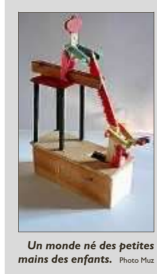
Un monde né des petites mains des enfants.